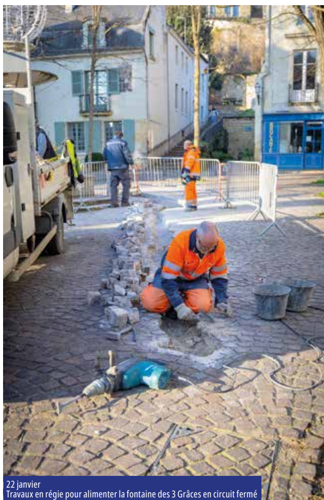
22 janvier Travaux en régie pour alimenter la fontaine des 3 Grâces en circuit fermé