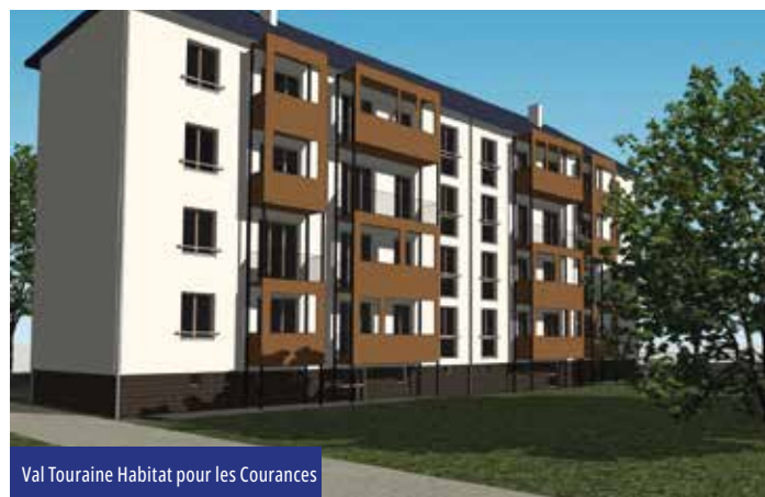
Val Touraine Habitat pour les Courances

Ce programme prévoit également la démolition de 2 immeubles, soit 24 logements, « dans une logique de diversification de l'habitat et de rééquilibrage de l'offre », précisent les responsables de Val Touraine Habitat. L'un des espaces libérés devrait être transformé en espace vert. Enfin, les locataires sont étroitement associés à cette opération d'envergure. Pour accompagner ce changement, des moments de