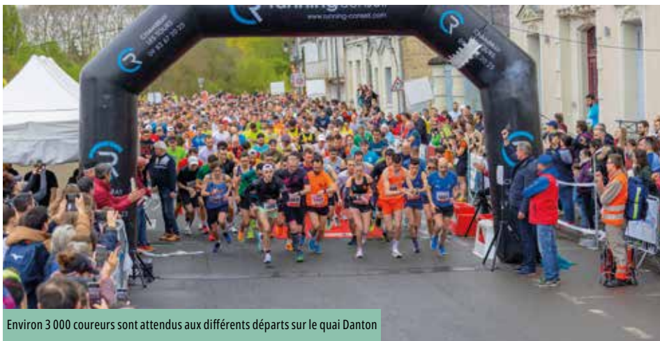
Environ 3 000 coureurs sont attendus aux différents départs sur le quai Danton

3 000 coureurs, soit un nouveau record de participation, sont attendus pour l'événement du 6 avril. En seulement 3 ans, le marathon de Chinon s'est hissé à la 2 e place des courses sur route d'Indre-et-Loire !