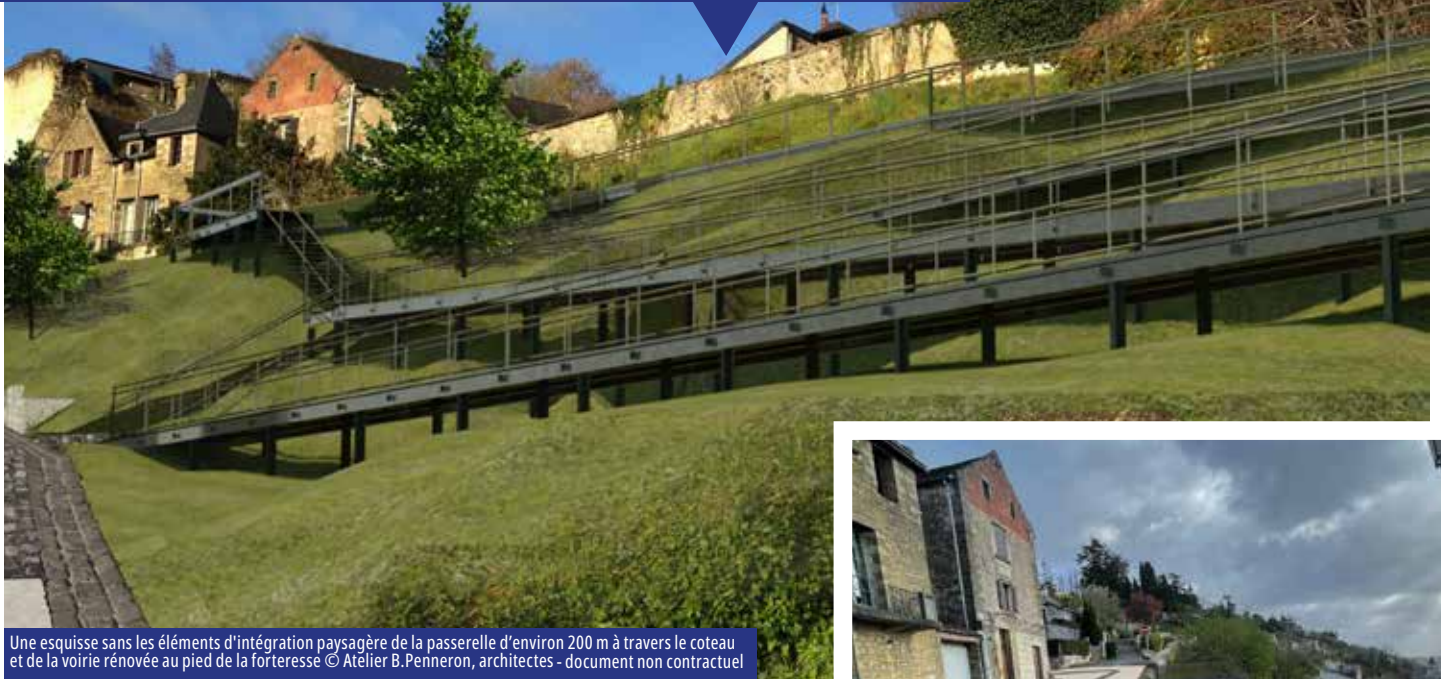
Une esquisse sans les éléments d'intégration paysagère de la passerelle d'environ 200 m à travers le coteau et de la voirie rénovée au pied de la forteresse © Atelier B.Penneron, architectes - document non contractuel