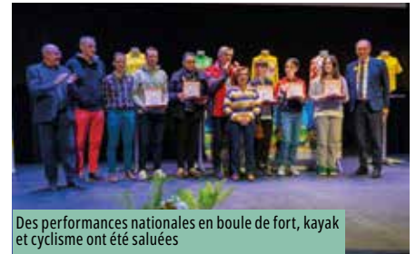
Des performances nationales en boule de fort, kayak et cyclisme ont été saluées

La cérémonie des vœux a aussi été l'occasion de mettre à l'honneur des sportifs chinonais qui ont brillé l'an passé.