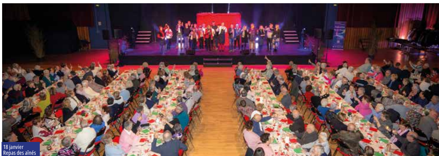
18 janvier Repas des aînés