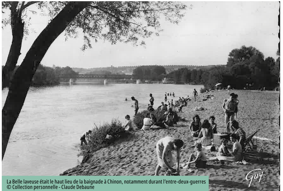
La Belle laveuse était le haut lieu de la baignade à Chinon, notamment durant l'entre-deux-guerres

Aujourd'hui aménagée en simple aire de repos et de promenade, la Belle laveuse a connu des heures bien plus fastes. Les Chinonais avaient l'habitude de se retrouver sur cette plage, à l'écart du centre-ville, avec la Vienne comme terrain de jeu nautique. Elle a surtout été très fréquentée à la fin du XIX e et au début du XX e siècle. Le site a connu son apogée durant l'entre-deux-guerres, avec l'installation d'une guinguette, d'un loueur