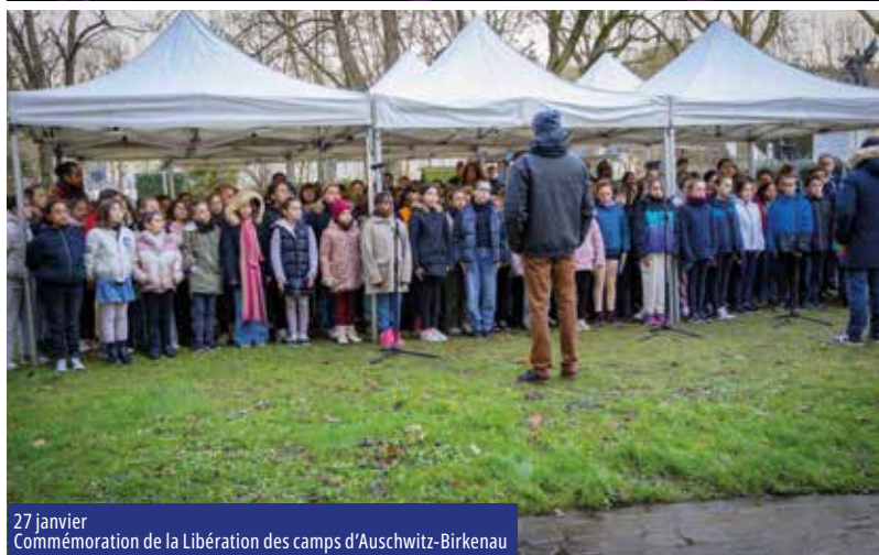
27 janvier Commémoration de la Libération des camps d'Auschwitz-Birkenau