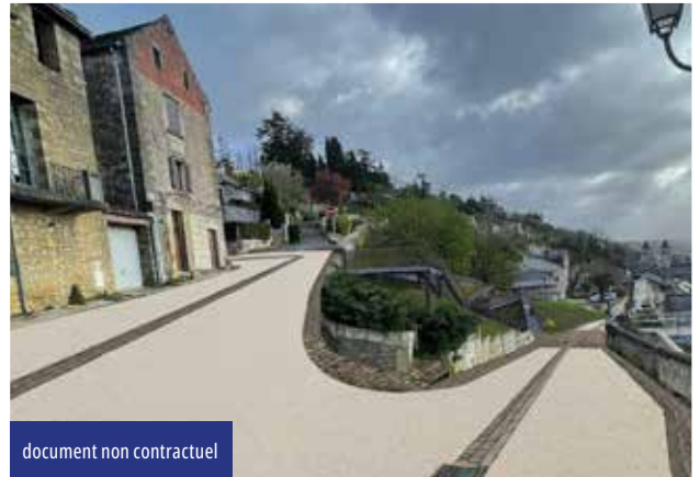
document non contractuel

Un projet à l'étude depuis plusieurs années va se concrétiser en 2025. Une rampe, accessible aux personnes à mobilité réduite et aux piétons, avec un belvédère et un escalier vont être aménagés sur le coteau situé face à l'ascenseur. Dans le même temps, la voirie menant à la forteresse sera rénovée.