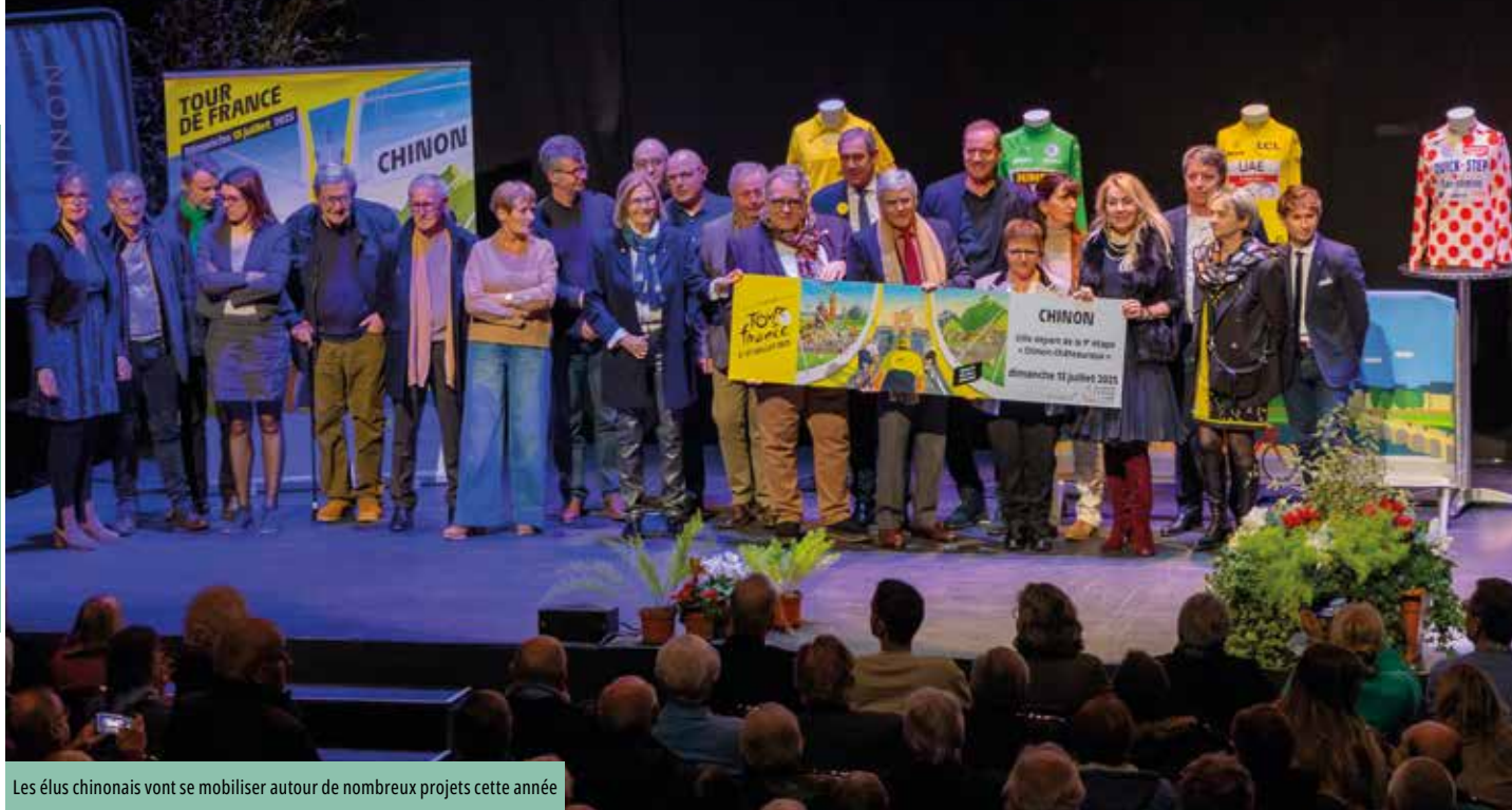
Les élus chinonais vont se mobiliser autour de nombreux projets cette année

L'année 2025 sera marquée par plusieurs programmes de construction de logements. Une dynamique immobilière bienvenue pour faire face à la demande, tout en respectant un développement équilibré de la ville.