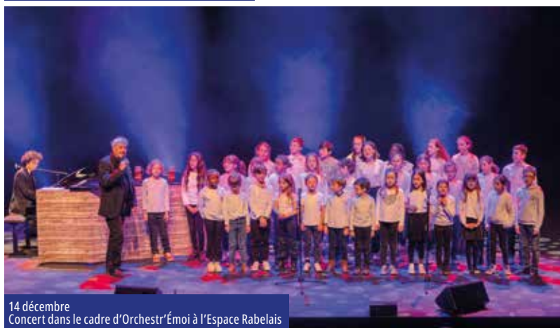
14 décembre Concert dans le cadre d'Orchestr'Émoi à l'Espace Rabelais