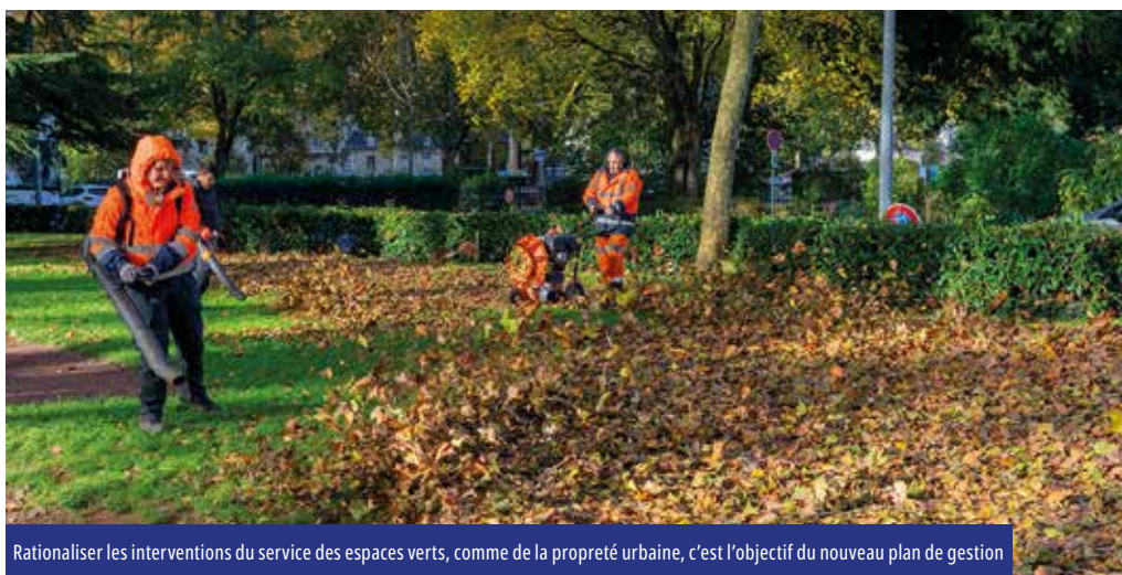
Rationaliser les interventions du service des espaces verts, comme de la propreté urbaine, c'est l'objectif du nouveau plan de gestion

Les mois de mars et avril marquent aussi la reprise des activités classiques avec les tontes, les plantations (...) qui seront pour la première fois effectuées sous le sceau du nouveau plan de gestion.