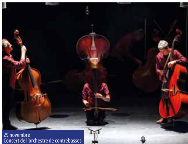
29 novembre Concert de l'orchestre de contrebasses