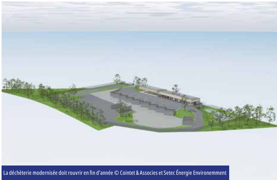
La déchèterie modernisée doit rouvrir en fin d'année

Le SMICTOM engage d'importants travaux de modernisation à la déchèterie à Chinon depuis la mi-février et jusqu'à la fin d'année. Pendant cette fermeture, de nouvelles possibilités sont proposées aux habitants.