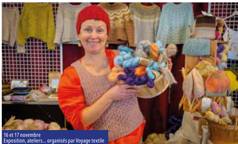
16 et 17 novembre Exposition, ateliers... organisés par Voyage textile