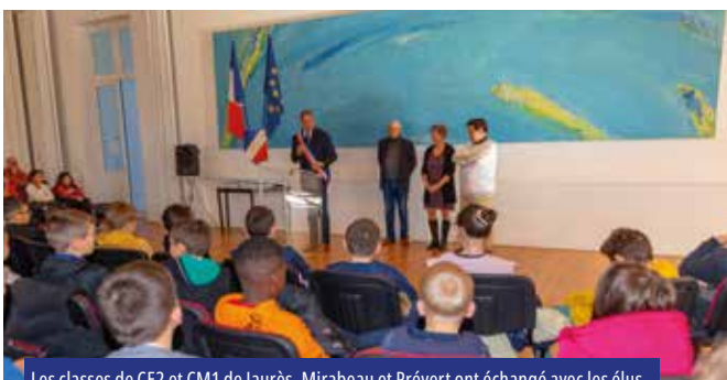
Les classes de CE2 et CM1 de Jaurès, Mirabeau et Prévert ont échangé avec les élus