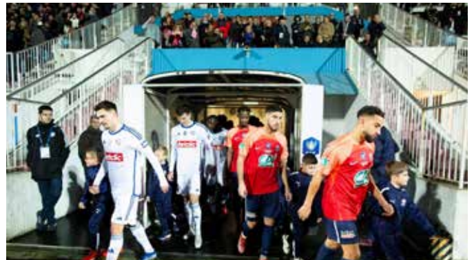
6 janvier La belle épopée en coupe de France du club de football de l'Avoine olympique Chinon Cinois s'est achevée logiquement en 32 e de finale. Face aux pros de Strasbourg (Ligue 1), l'A OCC s'est incliné 4 à 0 mais a vécu une belle expérience du très haut niveau et fait vibrer le nombreux public.