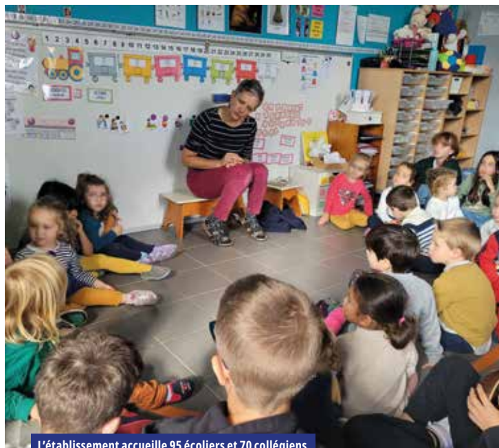
L'établissement accueille 95 écoliers et 70 collégiens

Un accompagnement éducatif est proposé, depuis septembre, aux élèves de CP à