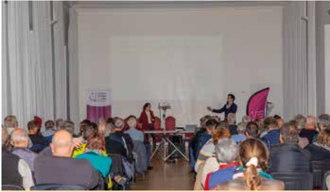
15 novembre Mieux comprendre le photovoltaïque, connaître les coûts et la rentabilité, s'informer sur les subventions, éviter les arnaques : c'était l'objectif de la conférence animée par l'ADIL France Rénov' Touraine et la communauté de communes en mairie de Chinon.