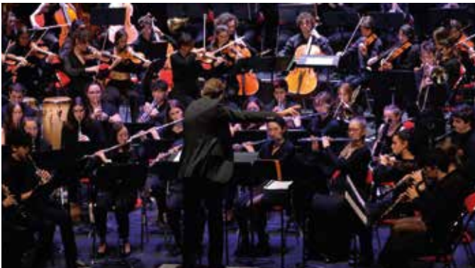
9 et 10 décembre La 6 e édition du festival Orchestr'émou a accueilli des ensembles venus de Tours, Poitiers, La Roche-sur-Yon et bien sûr de Chinon. L'événement organisé par Musiques et patrimoine, l'Orchestre de la vallée de Chinon et la communauté de communes a tenu toutes ses promesses.