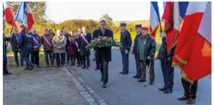
5 décembre La Journée nationale d'hommage aux morts pour la France pendant la guerre d'Algérie et les combats du Maroc et de la Tunisie s'est, cette année, déroulée à La Roche-Clermault pour l'ensemble du territoire. Des associations chinonaises et des élus locaux étaient présents à cette cérémonie.