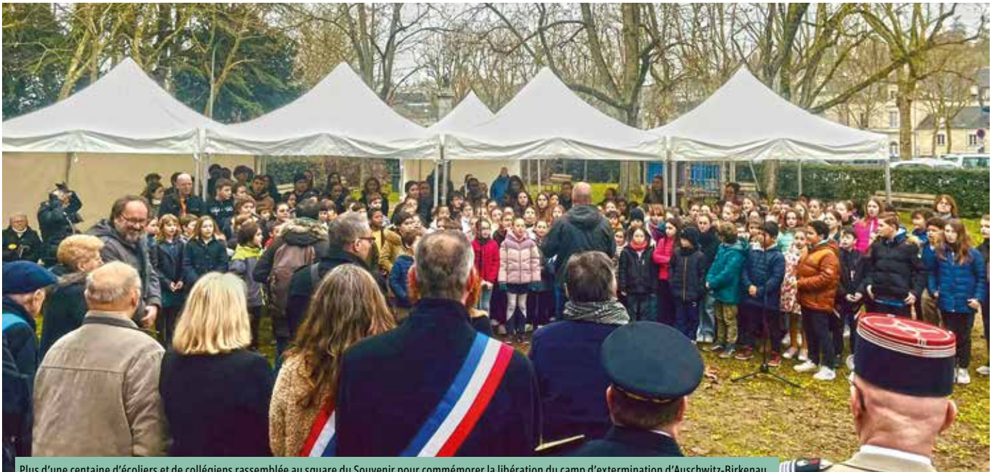
Plus d'une centaine d'écopliers et de collégiens rassemblée au square du Souvenir pour commémorer la libération du camp d'extermination d'Auschwitz-Birkenau