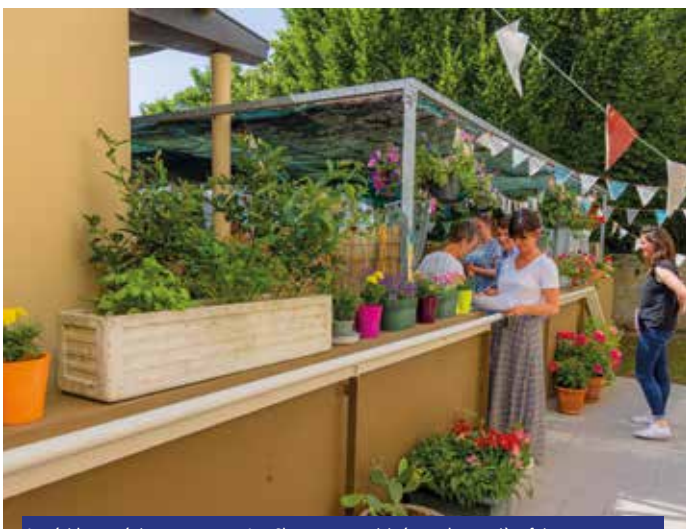
La résidence séniors autonomes Les Charmes a participé pour la première fois au concours