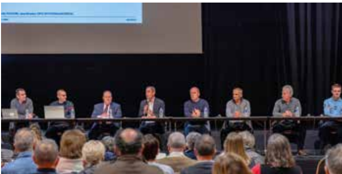
30 novembre Un public nombreux a assisté à la réunion concernant les Obligations légales de débroussaillage à l'espace Rabelais. L'objectif est de sensibiliser les propriétaires résidant à proximité d'un massif arboré ou possédant un espace vert pour assurer l'entretien nécessaire afin de limiter les risques d'incendie.