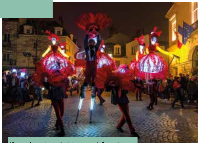
L'impressionnante parade de la compagnie Revue de rue