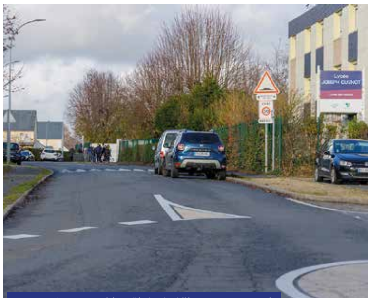
Une centaine de panneaux a été installée dans les différents quartiers concernés

Davantage de sécurité pour tous les usagers de la route comme pour les piétons et moins de nuisances pour les riverains, c'est l'objectif poursuivi par la ville de Chinon en augmentant le nombre d'axes limités à 30 km/h. Après l'hypercentre, les limitations de vitesse s'étendent à ses abords ainsi qu'à une partie de la rive gauche et le quartier des Hucherolles. L'objectif est de rationaliser au limitation de vitesse en ville.