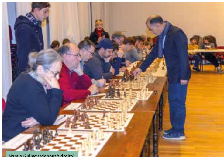
Namig Guliyev (debout à droite)

Namig Guliyev seul contre tous ! Le grand-maître des échecs a affronté en simultané une quarantaine de joueurs, vendredi 8 décembre, en mairie de Chinon. Face à ces adversaires de tout âge et de tout niveau, il n'a pas ménagé sa peine, prenant seulement quelques secondes de réflexion à chaque table sans jamais perdre le fil de sa stratégie.