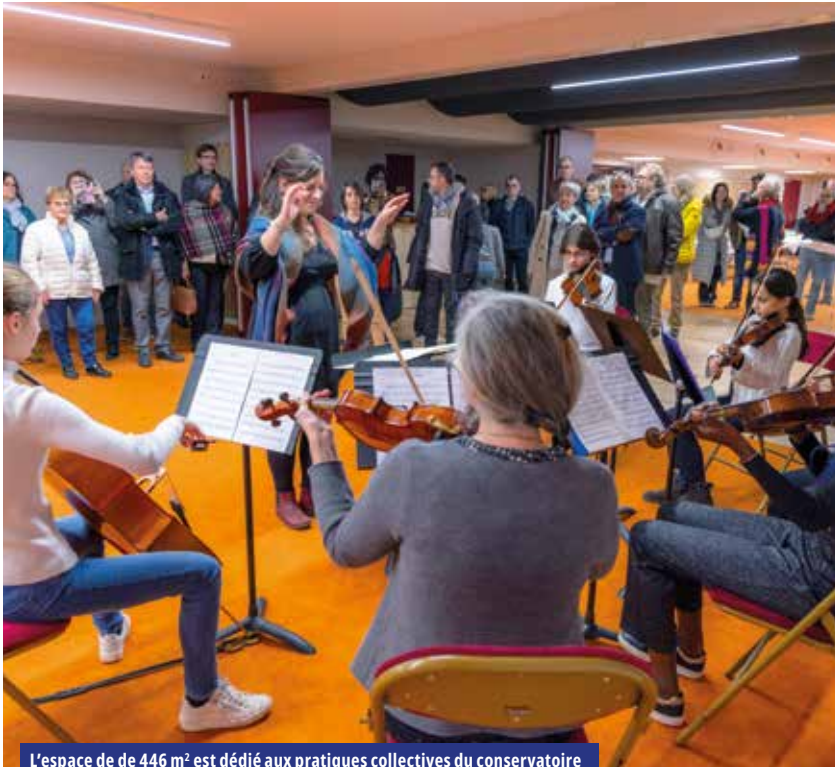
L'espace de 446 m 2 est dédié aux pratiques collectives du conservatoire

À l'étroit dans leurs locaux de la place Hofheim, les pratiques collectives du conservatoire intercommunal de Chinon viennent d'investir un nouvel équipement de la communauté de communes parfaitement adapté à leurs besoins, dans le quartier des Hucherolles.