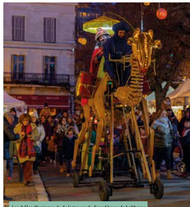
Les drôles d'animaux de la troupe du Grand bazar de balthazar