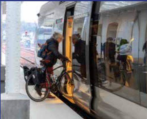
Les travaux ont notamment permis de rehausser les quais

Plus d'infos : ter.sncf.com/centre-val-de-loire/trajet-chinon-tours