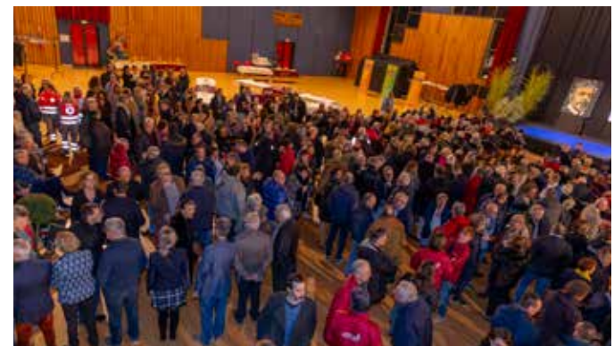
22 janvier Un public nombreux a assisté à la cérémonie des vœux de la municipalité à l'espace Rabelais. (lire pages 10 et 11)