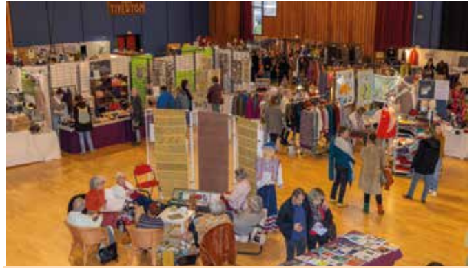
17, 18 et 19 novembre Le festival Voyage Textile, organisé par l'association éponyme, a embarqué les visiteurs dans une balade à travers le monde des fibres avec, à l'honneur cette année, les Andes. Des expositions, des ventes, des animations ou des conférences ont ponctué le week-end.