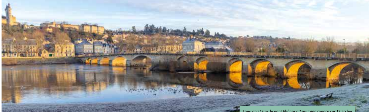
Long de 215 m, le pont Aliénor d'Aquitaine repose sur 12 arches

Il est emprunté au quotidien par près de 10 000 automobilistes qui ne mesurent sans doute pas qu'ils circulent sur un ouvrage chargé d'histoire... Le pont Aliénor d'Aquitaine a traversé les siècles et accompagné l'évolution de la ville.