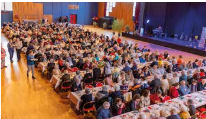
20 janvier Près de 400 convives ont été réunis à l'espace Rabelais pour le traditionnel banquet des aînés. Tous les Chinonais âgés de plus de 74 ans étaient invités par la municipalité à partager un déjeuner festif, agrémenté d'un spectacle.