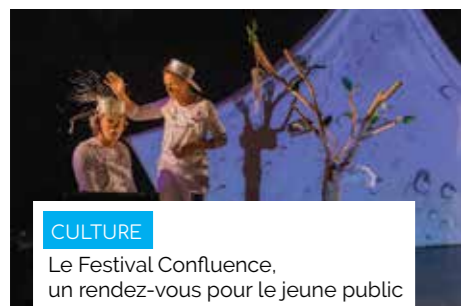
CULTURE Le Festival Confluence, un rendez-vous pour le jeune public