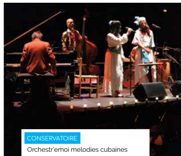
CONSERVATOIRE Orchestr'emoi melodies cubaines