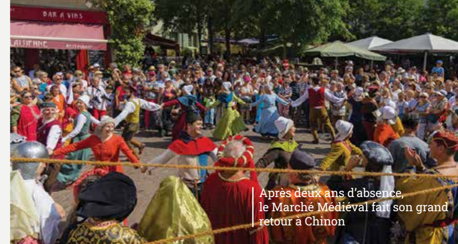
Après deux ans d'absence, le Marché Médiéval fait son grand retour à Chinon

La parade, qui sera définitivement organisée en fonction des conditions sanitaires devrait partir, comme les années précédentes, du Quai Danton pour revenir vers le centre-ville et la place du Général de Gaulle.