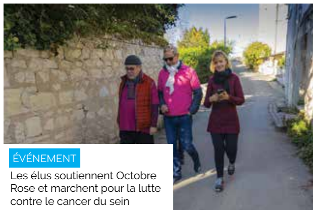
ÉVÉNEMENT Les élus soutiennent Octobre Rose et marchent pour la lutte contre le cancer du sein