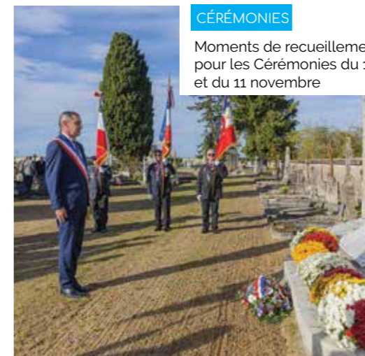
CÉRÉMONIES Moments de recueillement pour les Cérémonies du 1 er et du 11 novembre