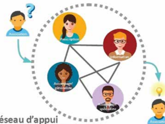
Réseau d'appui à la vie associative locale

Nous pourrions donc capitaliser sur celui-ci en profitant d'une veille d'information, d'outils et de documents de communication du réseau, de temps d'informations, de formations continues et d'un soutien technique et pédagogique départemental.