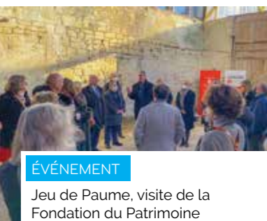
ÉVÉNEMENT Jeu de Paume, visite de la Fondation du Patrimoine