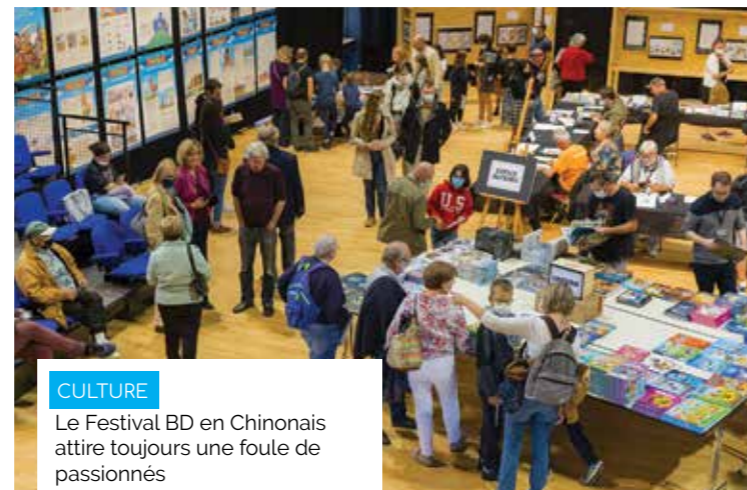
CULTURE Le Festival BD en Chinonais attire toujours une foule de passionnés