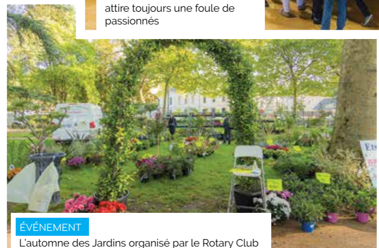
ÉVÉNEMENT L'automne des Jardins organisé par le Rotary Club