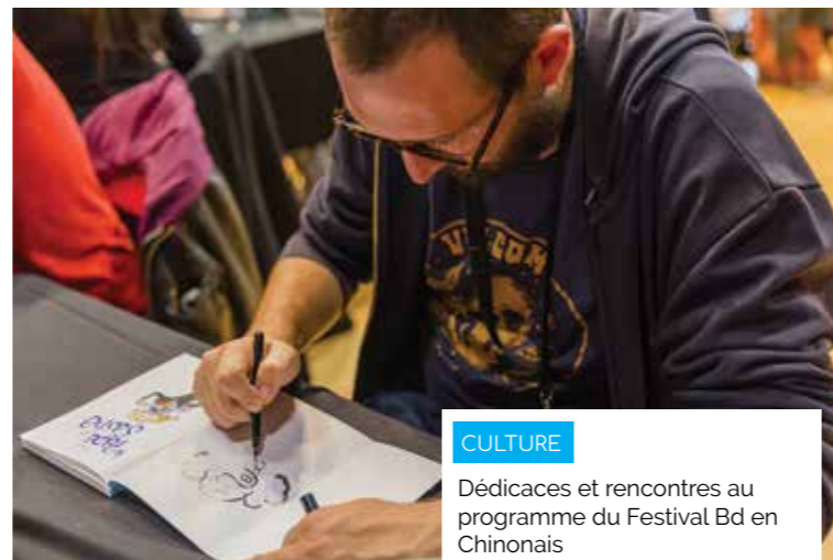
CULTURE Dédicaces et rencontres au programme du Festival Bd en Chinonais