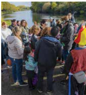
ÉVÉNEMENT Halloween à Chinon