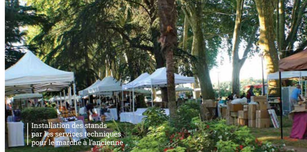
Installation des stands par les services techniques pour le marché à l'ancienne

Par exemple, un des événements majeur « le Chinon Classic » mobilise plus de 900 heures en moyens humains que ce soit dans l'organisation (116h), la manutention (715h) et tout ce qui touche à l'électricité et la plomberie (pour plus de 90 heures).