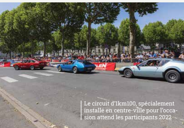
Le circuit d'1km100, spécialement installé en centre-ville pour l'occasion attend les participants 2022

Les organisateurs travaillent d'ores et déjà avec ferveur sur l'organisation générale de ces animations pour vous proposer un programme des plus complets avec quelques nouveautés pour 2022.