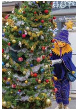
ÉVÉNEMENT Un Noël féérique à Chinon