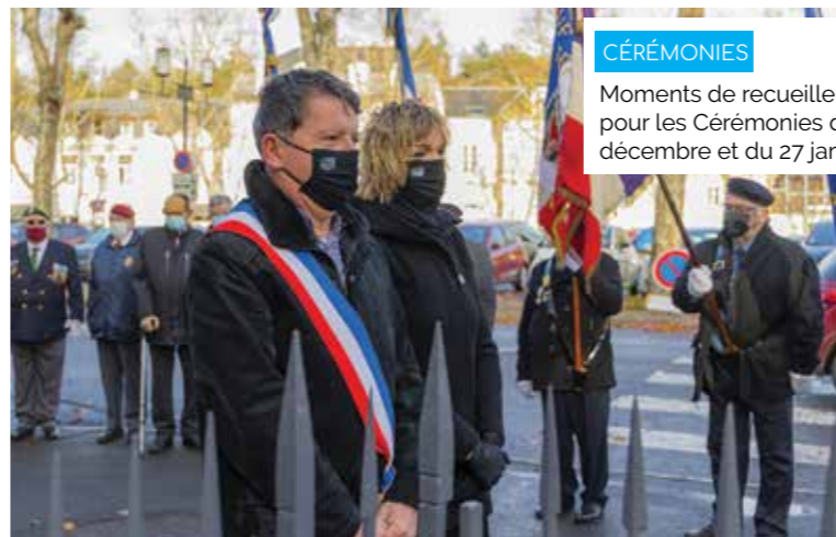
CÉRÉMONIES Moments de recueillement pour les Cérémonies du 5 décembre et du 27 janvier