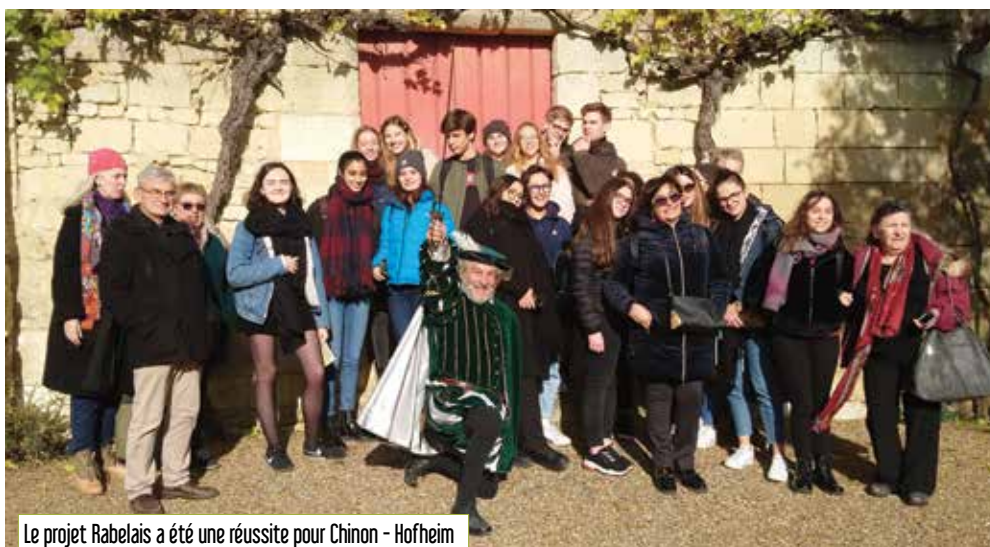
Le projet Rabelais a été une réussite pour Chinon - Hofheim