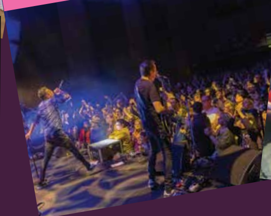
Fatals Picards, du Rock Chinon Rien