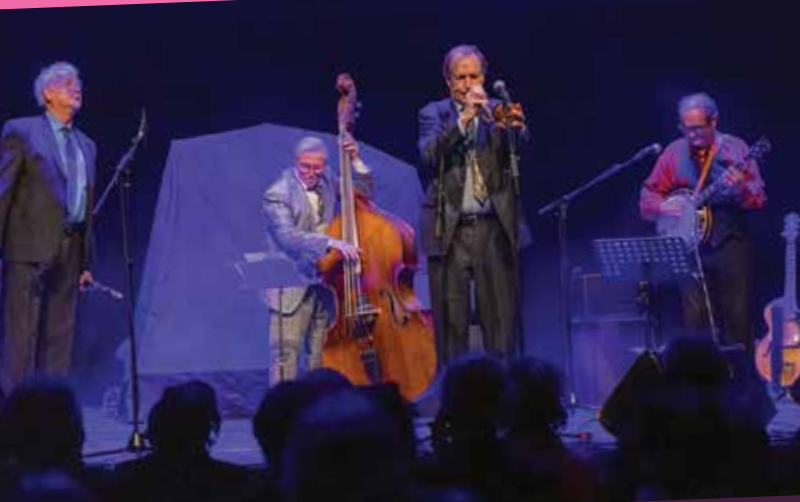
Concert AOC (Appellation d'origine Chinonaise)