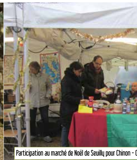
Participation au marché de Noël de Seuilly pour Chinon - C