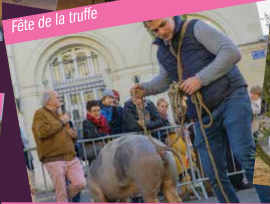
Fête de la truffe