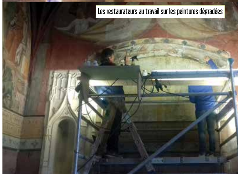
Les restaurateurs au travail sur les peintures dégradées