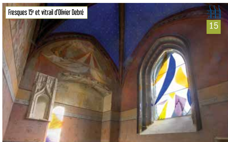
Fresques 15 e et vitrail d'Olivier Debré

Les dégradations les plus importantes ont été constatées au printemps 2019 sur des peintures du 15 e siècle, au rez-de-chaussée de la tour sud (la « réserve à légumes » du temps de l'école !), étudiées par les érudits depuis le 19 e siècle, elles représentent des thèmes symboliques tirés du Nouveau Testament : Jugement dernier, et une curieuse Fontaine de Piété, alimentée par le sang du Christ en croix. C'est une peinture figurant Dieu le père en gloire, entouré par des anges tenant les symboles de la passion, qui a le plus souffert en raison d'infiltrations dans le mur qui la porte. Ces infiltrations ont pu être stoppées grâce à des travaux de couverture, tandis que la restauration des peintures a eu lieu cet automne. Les artisans de l'atelier Moulinier ont réalisé des fixations des zones les plus fragiles et effectué des retouches à l'aquarelle pour restituer les zones disparues et contribuer ainsi à la lisibilité de l'ensemble.