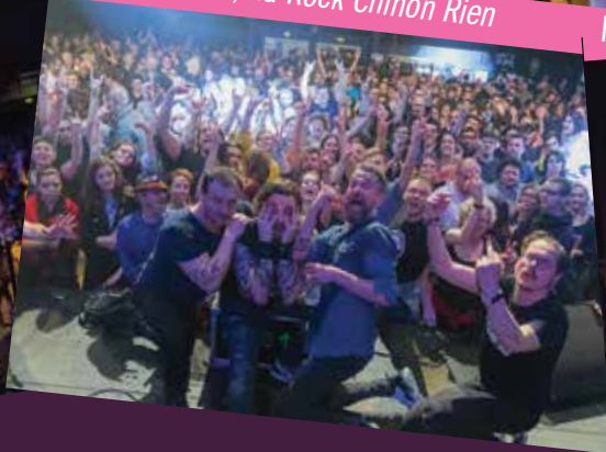
Fatals Picards, du Rock Chinon Rien