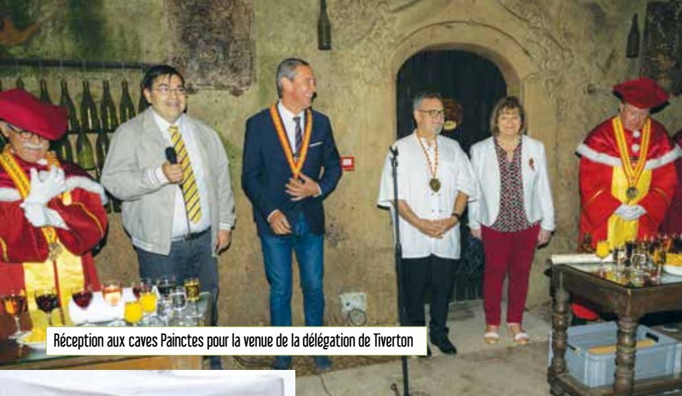
Réception aux caves Painctes pour la venue de la délégation de Tiverton