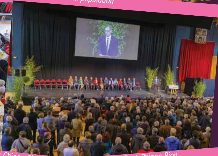
Fatals Picards, du Rock Chinon Rien