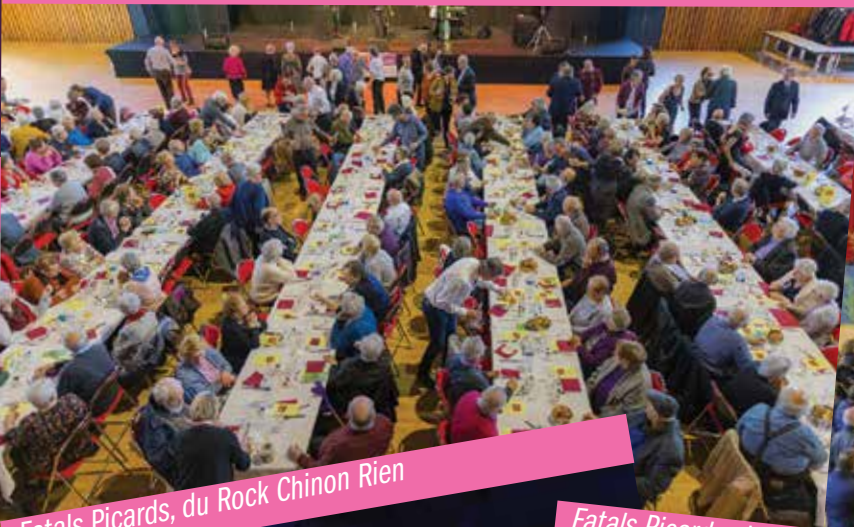
Vœux du maire à la population