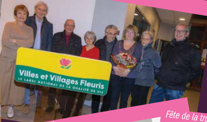
75ème anniversaire des camps d'Auschwitz