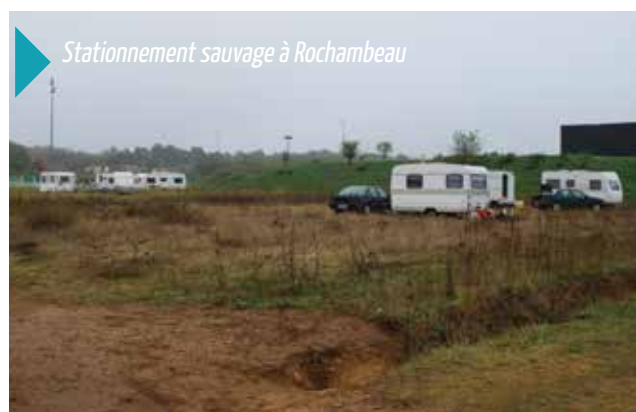
Stationnement sauvage à Rochambeau

La ville de Chinon demande systématiquement aux gens du voyage qu'ils rejoignent les aires de Trotte Loup ou de la Croix. Elle signale à EDF et Véolia tout vol de fluide ou d'énergie.