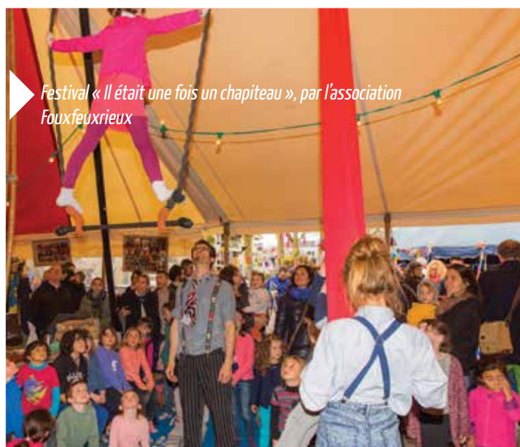
Festival « Il était une fois un chapiteau », par l'association Fouxfeuxrieux

C'est avec plaisir que je vous invite à découvrir les spectacles de la programmation culturelle 2016/2017.