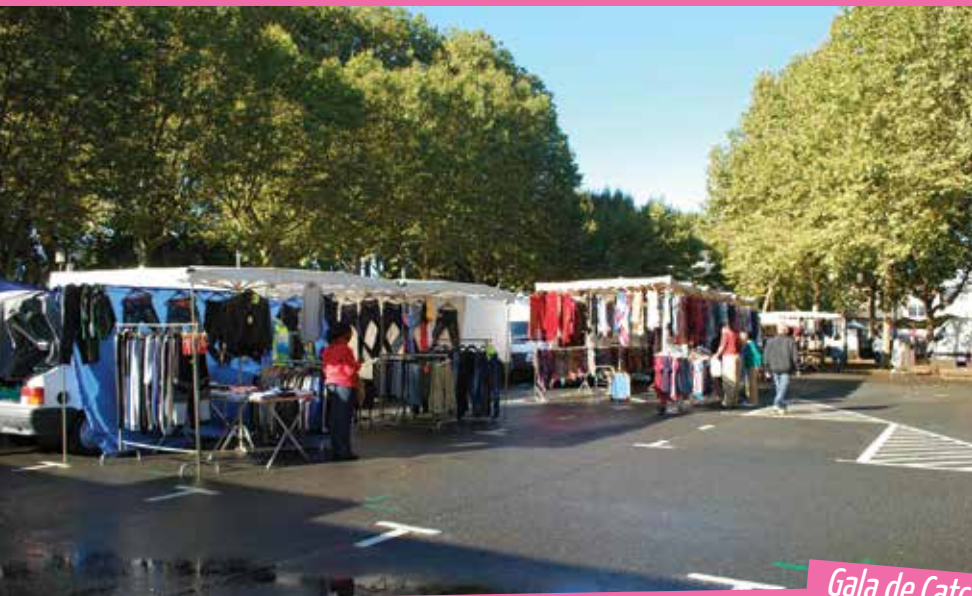
Festival Confluences - Octobre