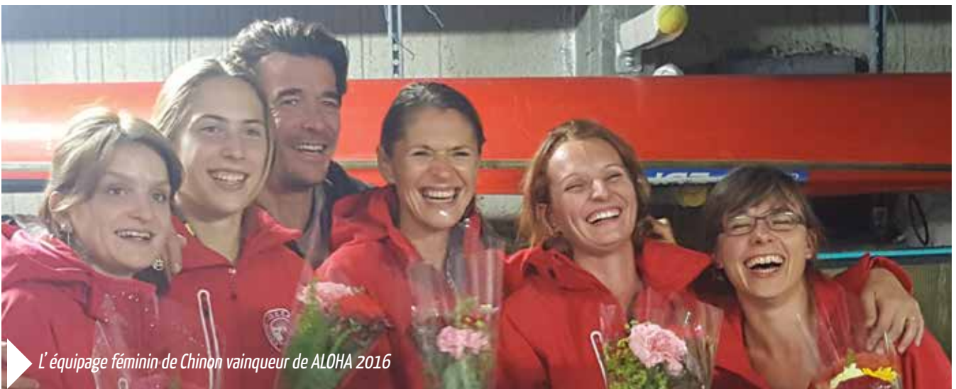
L'équipage féminin de Chinon vainqueur de ALOHA 2016

Ensemble, le club et l'association proposent la pratique de la pirogue féminine de façon régulière, deux fois par mois, pour des femmes luttant contre le cancer du sein.