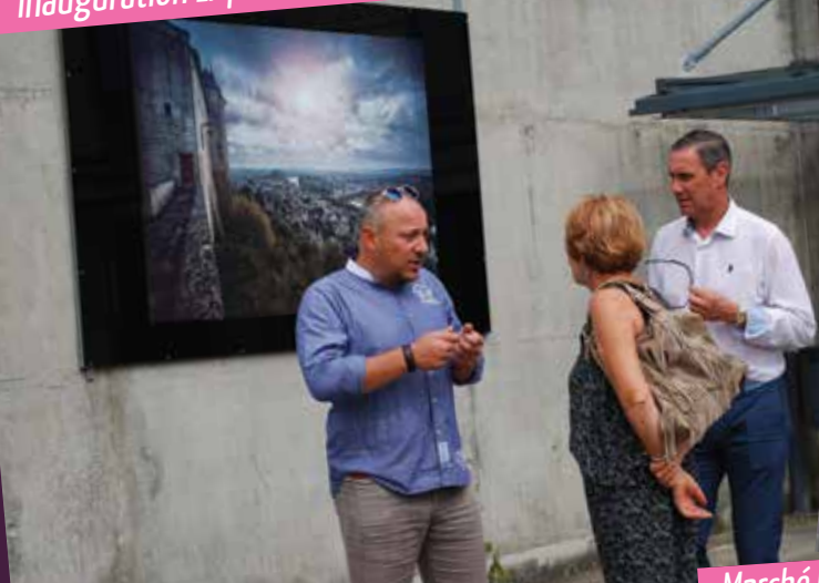
Cérémonie Officielle - 14 juillet