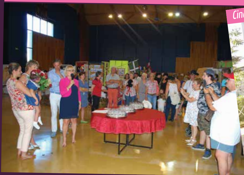
Cinéma d'Ailleurs - Septembre