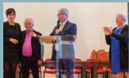
VIE CULTURELLE : La politique culturelle de la ville p. 16 et 17