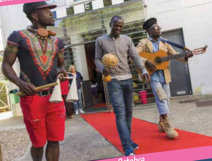
Foire d'automne - Octobre