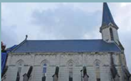
VIE LOCALE : Travaux p. 8