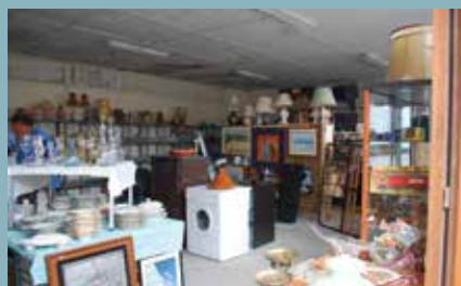
VIE ASSOCIATIVE : Emmaüs p. 13