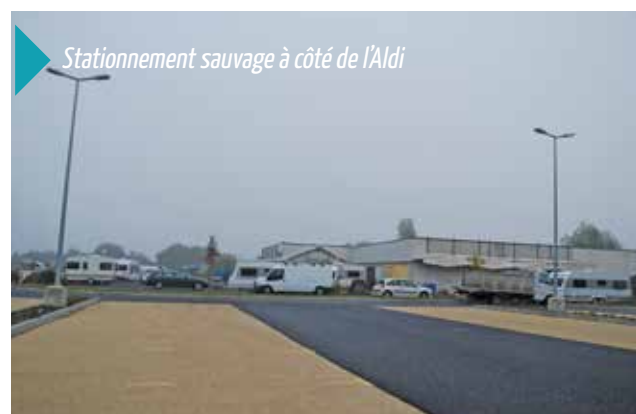
Stationnement sauvage à côté de l'Aldi