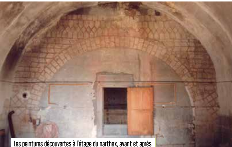
Les peintures découvertes à l'étage du narthex, avant et après restauration (1986-1990)